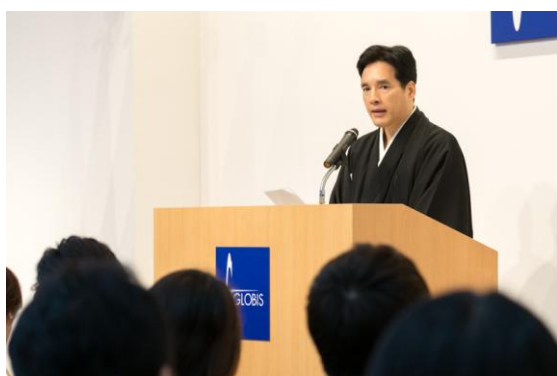
式辞を述べる堀義人学長

東京校入学式で学長の堀義人は、「2006年にはわずか70名程度だった在學生は今や1600名を超え、2500名近い創造と変革の志士である卒業生を社会に送り出してきました。最近では、数多くの卒業生の活躍を見聞きするようになり、これ以上の喜びはありません。グロービスは、規模の面でも評価の面でも日本No.1の経営大学院になりました。自分の可能性を信じ、創造と変革を成し遂げるに学びを身につけてほしい」と式辞を述べました。