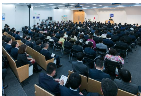
東京校入学式の様子(日本語プログラムの2回目)